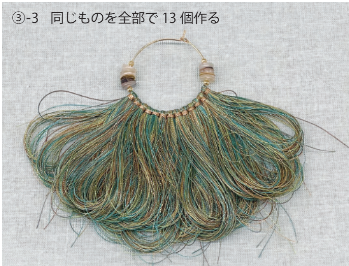
③-3 同じものを全部で13個作る