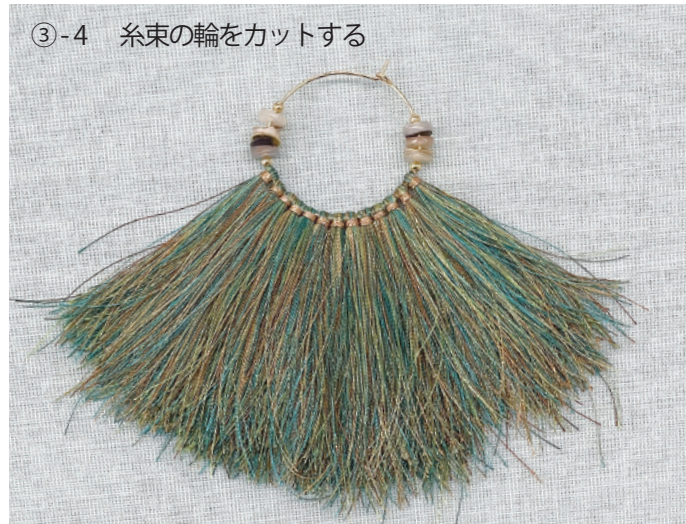
③-4 糸束の輪をカットする