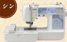
ブラザーミシン Family Marker FM800

★ミシンに関するお問合せは… ブラザー販売株式会社「お客様相談室」 ☎0120-340-233 http://www.brother.co.jp