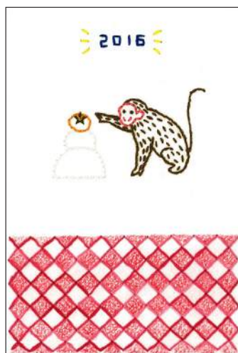
できあがりイメージ