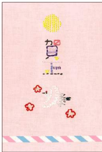
できあがりイメージ